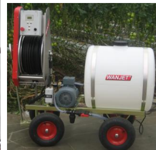
300 liter tank met aangedreven haspel

Holland Green Machine Eric Gerritsma Bloemberg 22 7924 PW Veeningen